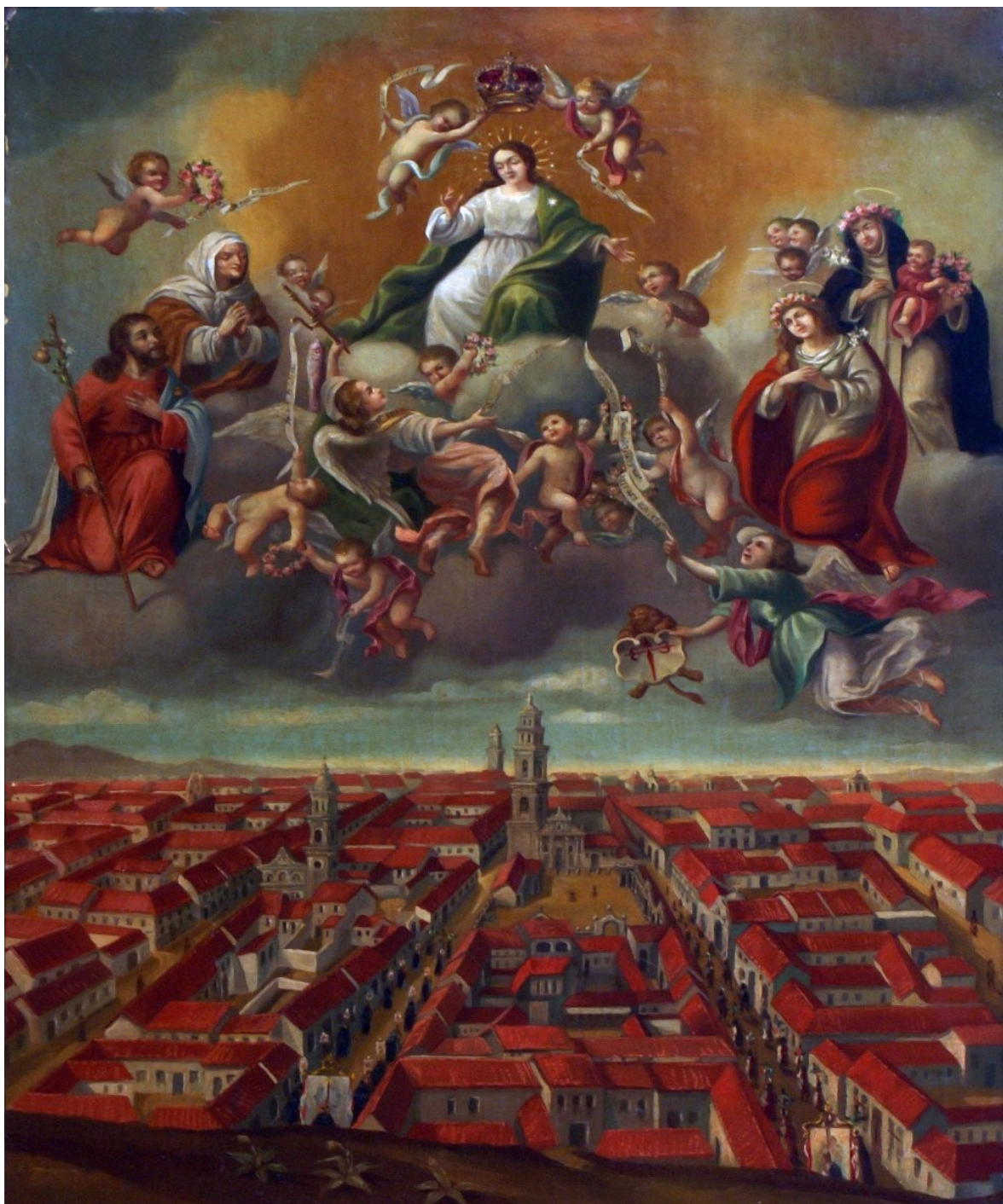
Anónimo, Nuestra señora de Caracas, 1766. Colección Consejo Municipal, Museo de Caracas.

Esta edificación, que fue declarada Monumento Histórico Nacional en 1973, siguió funcionando como sede del Gobierno Municipal, como los Tribunales, la Comandancia de Policía; por su parte, el Seminario fue destinado a ser el Salón de Sesiones del Concejo Municipal. Sin embargo, en la década de 1960 es restaurado y abierto al público. Finalmente,