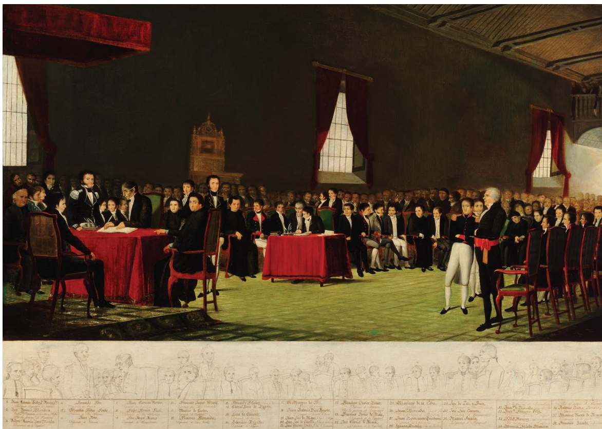
Juan Lovera, “El 5 de julio de 1811”, de 1838. Este Congreso Constituyente se llevó a cabo en la capilla del Seminario Santa Rosa de Lima.

Con la conformación de la República de Colombia, también conocida como Gran Colombia, El Libertador Bolívar, como presidente, comienza a diseñar una universidad adaptada a esa nueva era. Tras la elección del doctor José María Vargas como rector, se modificaron los estatutos, dando paso a Los Estatutos Republicanos de la Universidad Central Venezuela , en 1827. Debido al daño a la estructura de la edificación, tanto por las guerras como por los embates de la naturaleza, en 1829, el arzobispo Ramón Ignacio Méndez solicita su reparación, sin embargo: